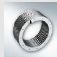
Inox-Radial hőcserélő saválló nemesacélből